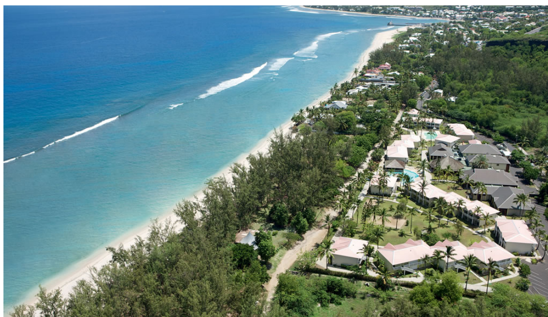
Hôtel Le Récif