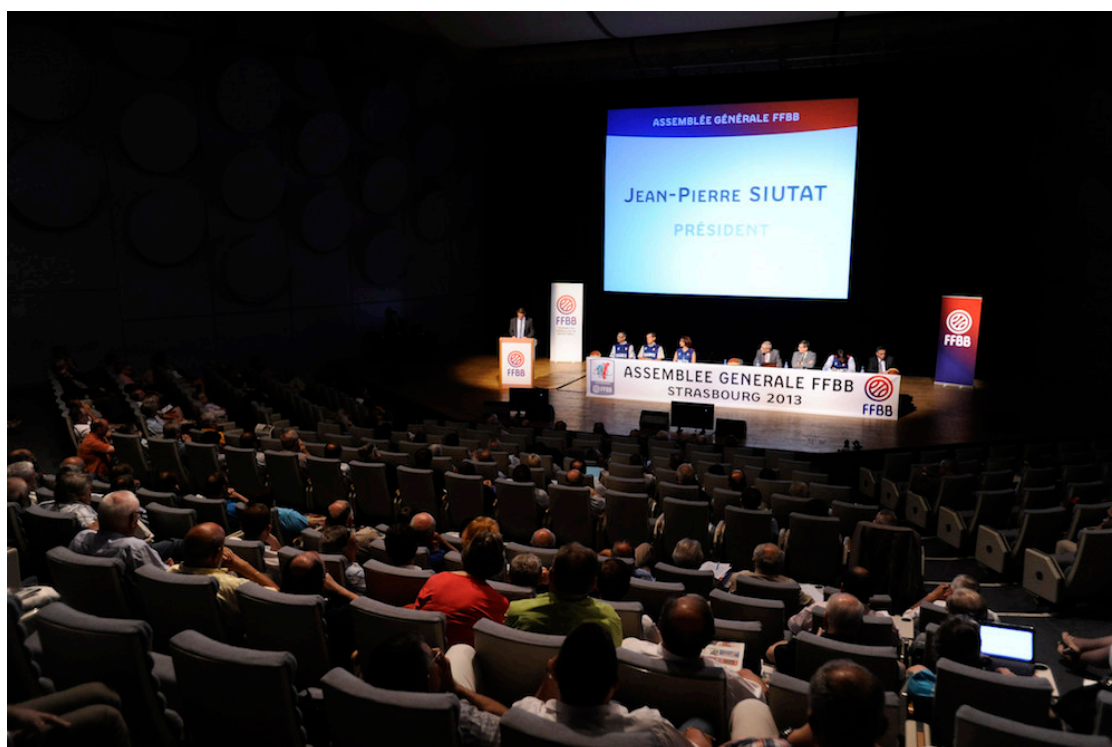
Assemblée Générale de la FFBB en 2013 Au Palais des Congrès de Strasbourg